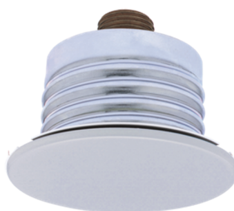
Sprinkler i undertak